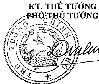
Vương Đình Huệ