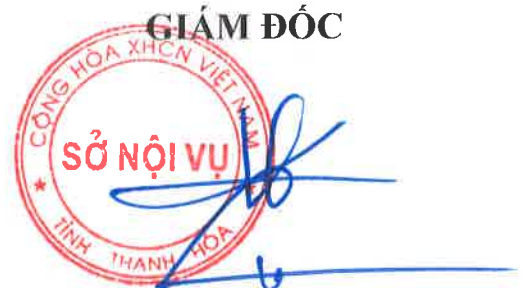
Nguyễn Xuân Thủy